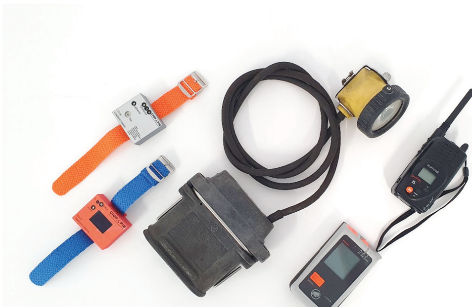
Rycina 1. Przykładowe lokalizatory nasobne: system lokalizacji wykorzystywany w górnictwie; lokalizator lawinowy używany przez narciarzy i ratowników górskich; lokalizatory wykorzystywane w przemyśle oraz radiotelefon

W każdym przypadku stosowania nasobnych lokalizatorów elektromagnetycznych konieczne jest jednak przeanalizowanie celu i okoliczności, w jakich urządzenia te mają być wykorzystywane, i dobranie do nich priorytetowych cech funkcjonalnych i konstrukcyjnych poszczególnych urządzeń (w tym rodzaju i poziomu emisji elektromagnetycznych z nasobnych lokalizatorów).