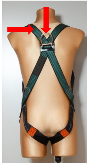
Rys. 3. Pasy barkowe skrzyżowane w grzbietowej klamrze zaczepowej szelek bezpieczeństwa

prędkością co najmniej 1000 klatek/s. Początkowa pozycja manekina przed rozpoczęciem spadania pionowa - głową do góry.