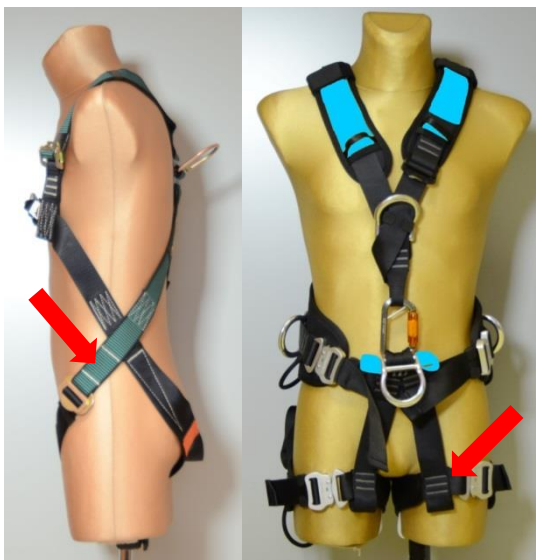
Rys. 1. Przykładowe rozwiązania pasów udowych w szelkach bezpieczeństwa

powinny mieć konstrukcję minimalizującą nacisk taśmy włókienniczej na ciało użytkownika podczas powstrzymywania spadania z wysokości i zawieszenia po powstrzymaniu spadania. Nadmierny nacisk pasów udowych może prowadzić do poważnych zaburzeń w funkcjonowaniu układu krwionośnego człowieka, a szczególnie w jego nogach, co może być groźne dla jego zdrowia a nawet życia.