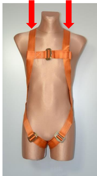
Rys. 2. Pasy barkowe szelkach bezpieczeństwa

do tyłu i w bok) pasy barkowe nie zsuwały się z ramion użytkownika i nie powodowały jego uwolnienia.