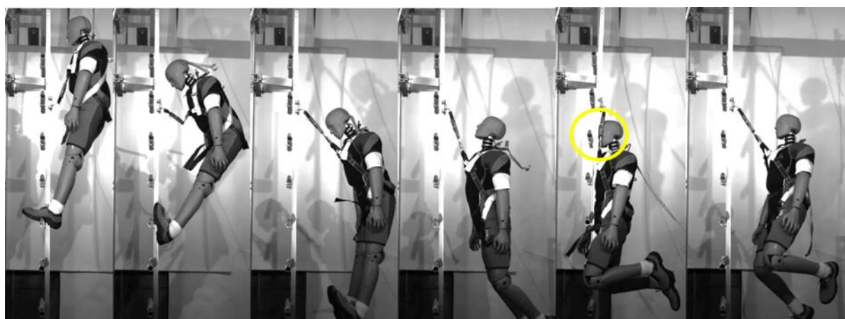
Rys. 7. Uderzenie głową o prowadnicę urządzenia samozaciskowego podczas powstrzymywania spadania