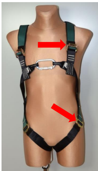
Rys. 4. Przykładowe rozmieszczenie klamer spinająco-regulacyjnych w szelkach bezpieczeństwa