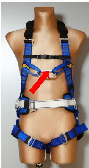
Rys. 5. Przykładowe usytuowanie piersiowej klamry zaczepowej w szelkach bezpieczeństwa