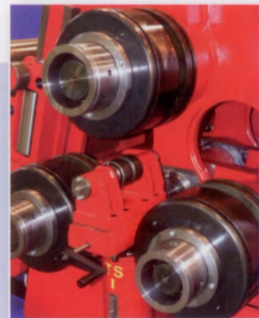
Okladka: fol. J. Kalek