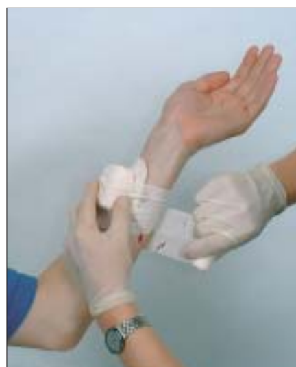
Opatrywanie rany, w której tkwi ciało obce