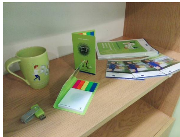
Nagrody w Akademii Bezpiecznego Dzieciaka organizowanej przez Politechnikę Częstochowską