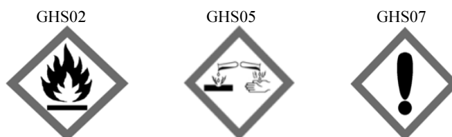
Rys. 1. Kody hasła ostrzegawczego „Niebezpieczeństwo”. Piktogramy określone w rozporządzeniu WE nr 1272/2008 (CLP) mają czarny symbol na białym tle z czerwonym obramowaniem, na tyle szerokim, aby było wyraźnie widoczne

Flam. Liq. 3 – substancje ciekłe łatwopalne, kategoria zagrożenia 3. Acute Tox. 4 * – toksyczność ostra (przy wdychaniu), kategoria zagrożenia 4. Acute Tox. 4 * – toksyczność ostra (droga pokarmowa), kategoria zagrożenia 4. Skin Corr. 1B – działanie żrące/drażniące na skórę, kategoria zagrożenia 1.B. H326 – łatwopalna ciecz i pary. H332 – działa szkodliwie w następstwie wdychania. H302 – działa szkodliwie po połknięciu. H314 – powoduje poważne oparzenia skóry oraz uszkodzenia oczu. Dodatkowe zwroty informujące o zagrożeniach: Skin Irrit. 2 – działanie żrące/drażniące na skórę. H315 – działa drażniąco na skórę. Eye Dam. 1 – poważne uszkodzenie oczu/działanie drażniące na oczy. H318 – powoduje poważne uszkodzenie oczu. Eye Irrit. 2 – poważne uszkodzenie oczu/działanie drażniące na oczy. H319 – działa drażniąco na oczy. STOT SE 3 – działanie toksyczne na narządy docelowe – narażenie jednorazowe. H335 – może powodować podrażnienie dróg oddechowych.