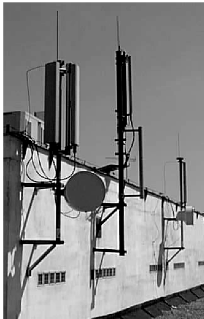
Fot. Anteny stacji bazowej systemu telefonii komórkowej

Lawinowy rozwój telefonii komórkowej stał się powodem szczególnego zainteresowania skutkami zdrowotnymi ekspozycji ludzi na promieniowanie, zarówno terminali jak i stacji bazowych.